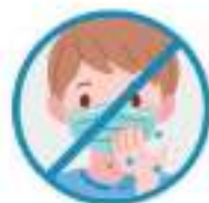
착용중 마스크 만지지 않기 만진 후 깨끗이 손씻기