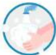
마스크 착용 전 깨끗이 손 씻기