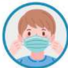
입과 코를 가리고, 틈이 없도록 착용